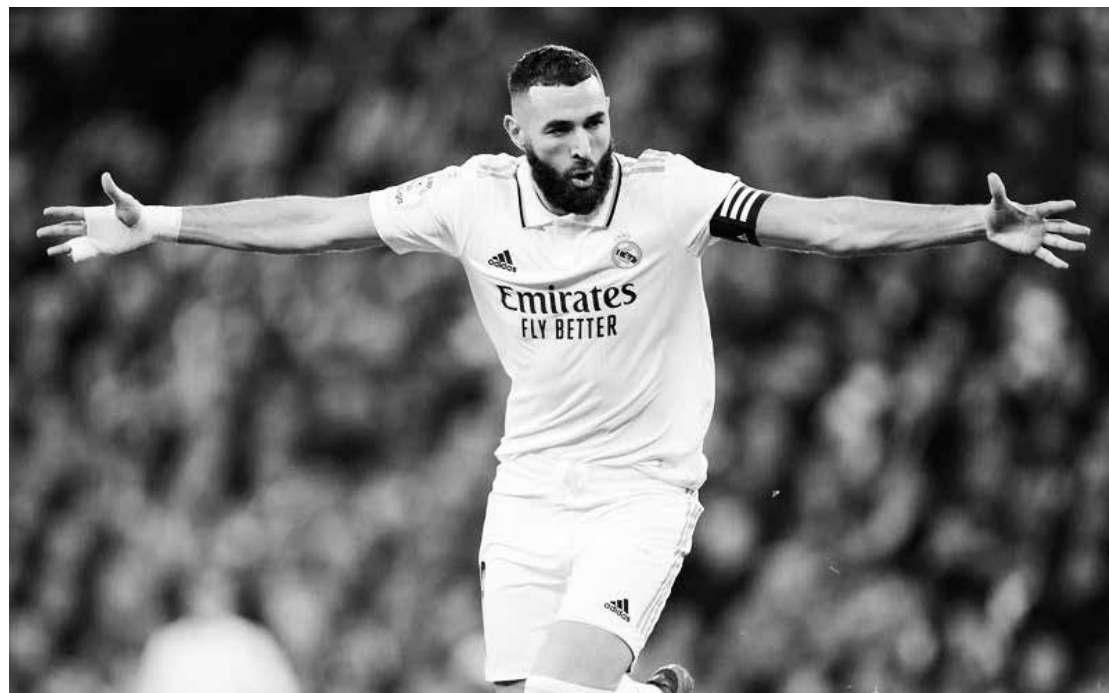
Benzema está entre os cinco maiores goleadores da Liga Espanhola após o jogo contra o Elche CF