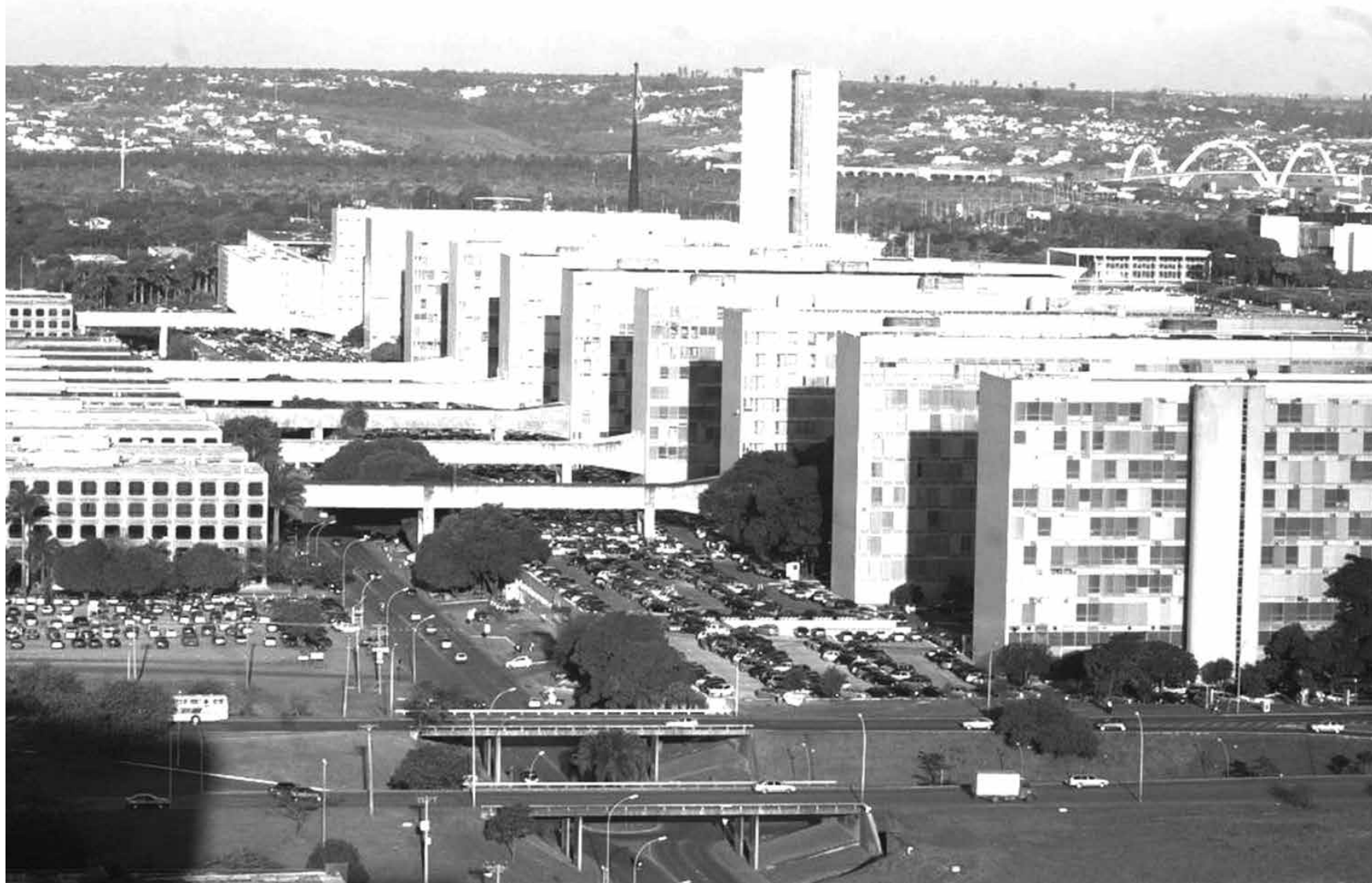
Em geral, as carreiras do funcionalismo federal estão sem reajuste nos rendimentos desde 2019, mas há algumas categorias com salário defasado desde 2017

O Ministério da Gestão ainda prometeu que até maio irá apresentar o calendário de discussões dos pleitos e propostas para 2024.