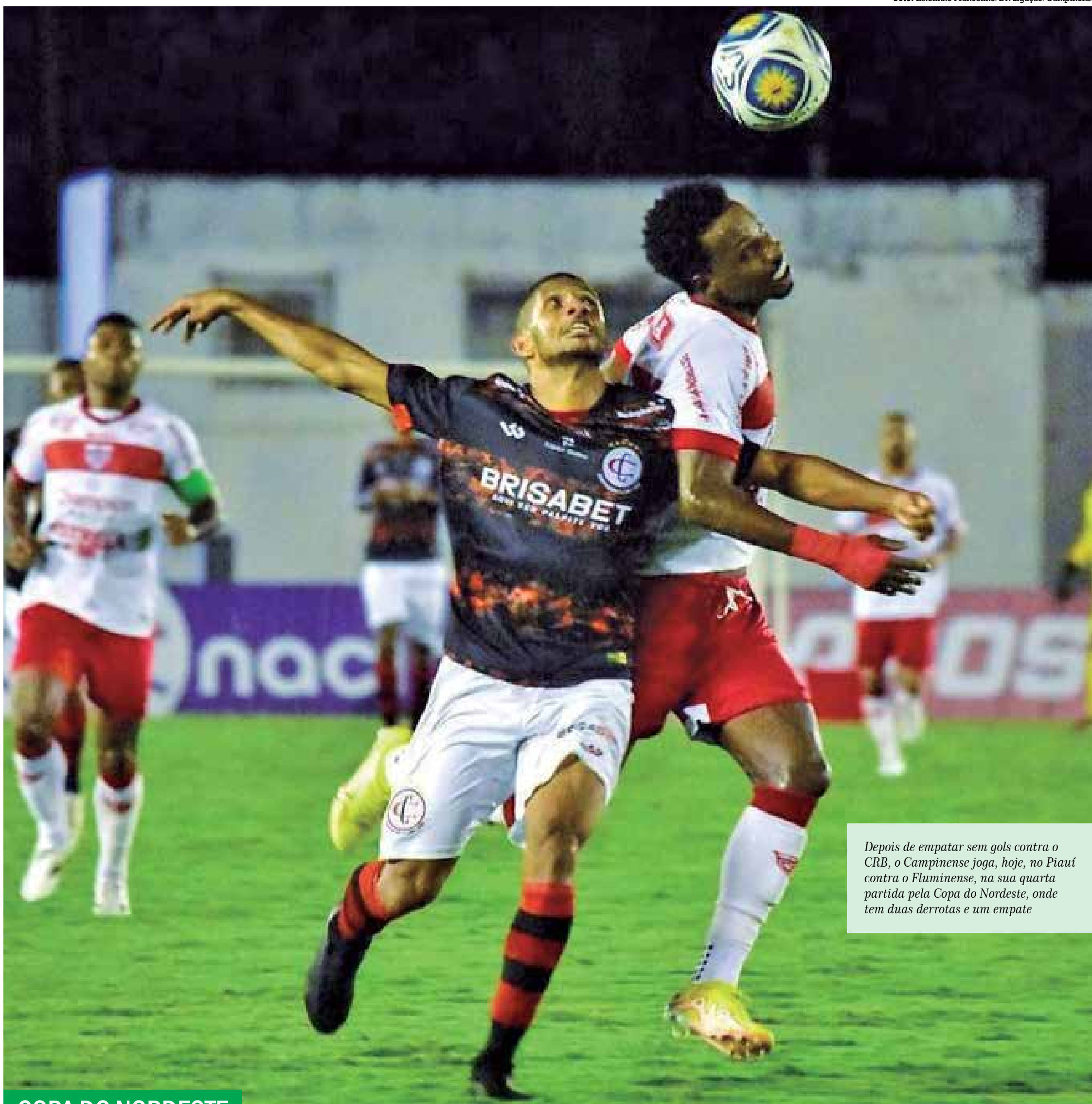
Depois de empatar sem gols contra o CRB, o Campinense joga, hoje, no Piauí contra o Fluminense, na sua quarta partida pela Copa do Nordeste, onde tem duas derrotas e um empate