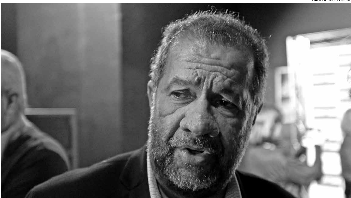
O ministro Carlos Lupi afirmou que o mutirão da perícia médica deve ser iniciado com prioridade em três estados do Nordeste

A expectativa do governo é que, até dezembro, o tempo médio de espera por uma perícia médica caia para 45 dias