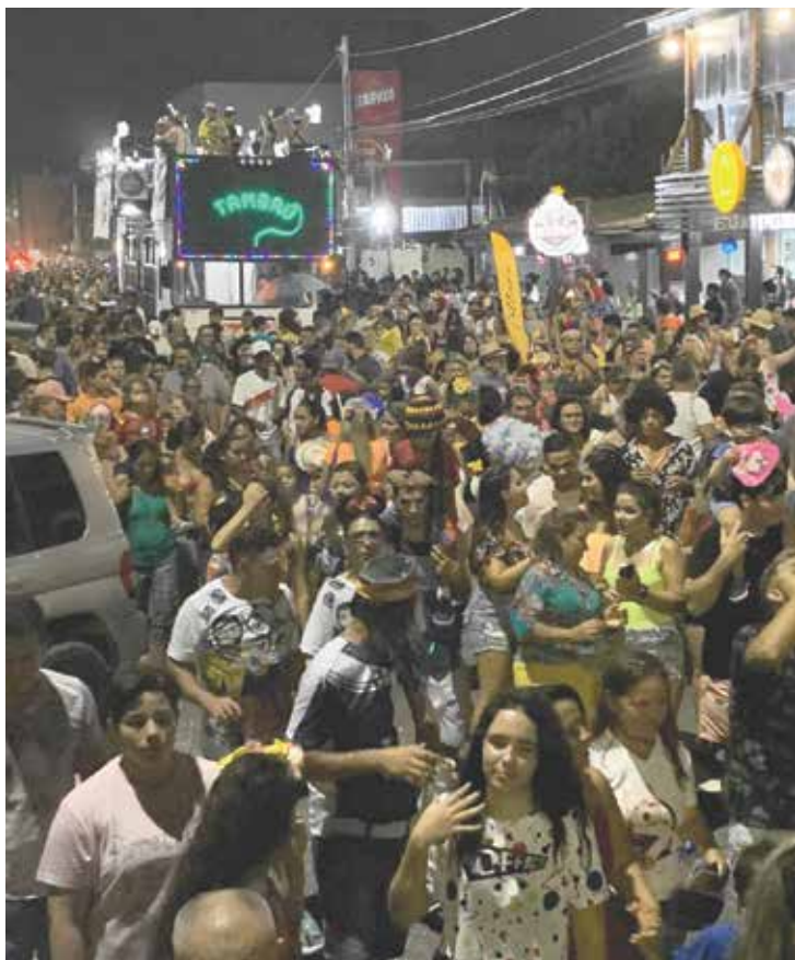
Descentralização dos blocos para os bairros é o principal destaque do encerramento do Folia de Rua; Boi do Bessa aguarda o maior número de foliões