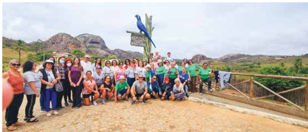
Curso proporciona experiências e convívio social aos alunos, que têm de 60 a 95 anos