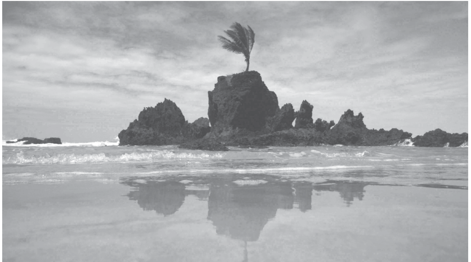
Praia de Tambaba, assim como outras localidades do município de Conde, terá programação carnavalesca com desfile de blocos

Hoje, no primeiro dia de Carnaval no Conde, desfilam dois blocos. Às 17h, vai para a avenida o dos torcedores do Flamengo, o bloco “Eternamente Flamengo”, e logo em seguida, às 18h, a folia continua com o bloco “Oliveiras”, com a Orquestra Paraíso Tropical. O desfile de ambos os