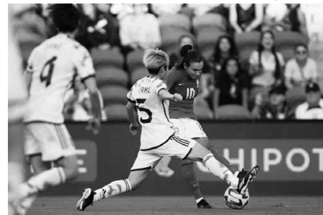
O retorno de Marta foi bastante comemorado pela atleta