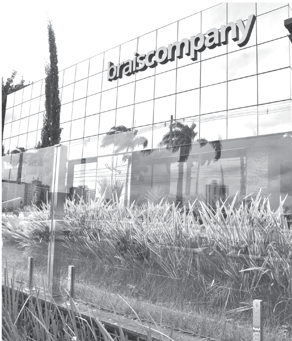
A Polícia Federal realizou buscas na sede da empresa Braiscompany, em Campina Grande

Porém, no sumário executivo da Braiscompany, a empresa foi fundada no dia 23 de maio de 2018, na Junta Comercial do Estado da Paraíba (Jucep-PB).