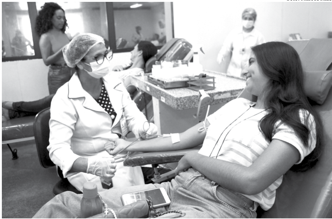
Hemocentro da Paraíba atenderá o público em horário especial hoje e na próxima semana

Para se tornar doador de sangue, basta comparecer ao