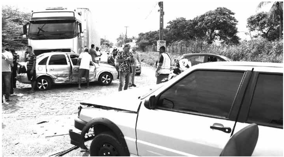
O acidente causou danos nos veículos e três pessoas foram levadas para o Trauma

Uma perícia ficou de ser feita no local, para que sejam descobertos os reais motivos que culminaram com o acidente. As informações foram prestadas pelo tenente Pedro Henrique de Araújo Coelho, do Corpo de Bombeiros Militar da Paraíba.