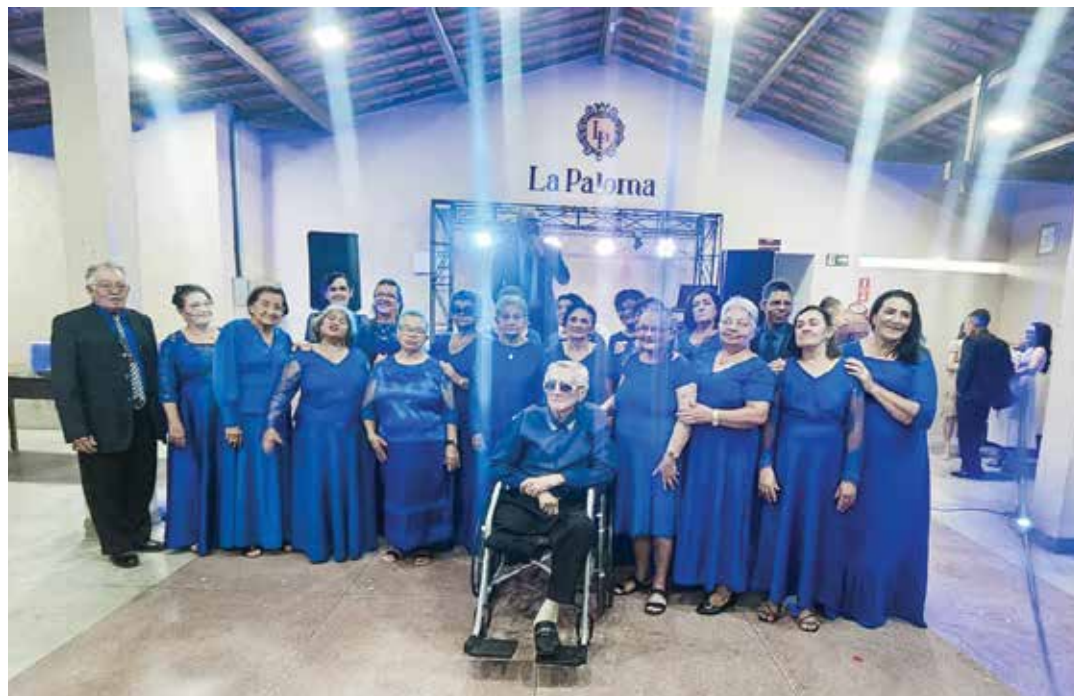
Formandos durante uma cerimônia de colação de grau, na universidade: experiência única